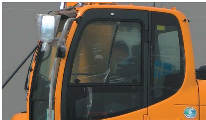
Podwozie maszyny oparto na stabilnej, odpornej na działanie sił skręcających ramie. Bezobsługowe ogniwa łańcuchów i rolki podwozia zostały fabrycznie nasmarowane i uszczelnione

że te ambitne plany udało się w pełni zrealizować. Nowa generacja koparek Hyundai Serii 9 imponuje łatwością obsługi i serwisowania, wydajnością i ekonomiczną eksploatacją. Tym samym Hyundai potwierdza swą przynależność do światowej czołówki producentów koparek hydraulicznych. Odwiedzający stoisko koreańskiego koncernu na targach Bauma wykazywali ol-