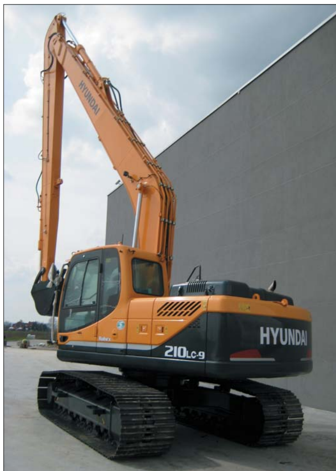
Koreańscy konstruktorzy zadbali, by operatorzy nowej generacji koparek Hyundai pracowali w komfortowych warunkach